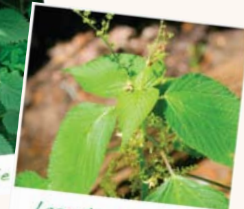
Laportéa du Canada