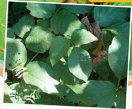
Herbe à puce