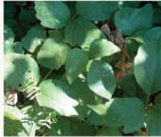
Herbe à puce