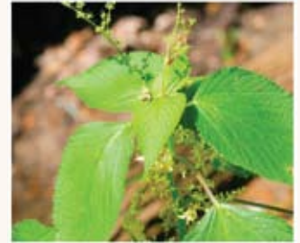
Laportéea du Canada