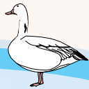
Grande oie des neiges